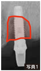
インプラント周囲炎の例。赤いところがバイ菌でインプラントの周りの骨が溶けている。

残りの歯の歯周病の治療などを行わないでインプラント治療を行うと、残りの歯が次々に抜けていきます。また、せっかく入れたインプラントが後に歯周病に感染し、インプラント周囲炎になることも少なくありません(写真1)。インプラント治療前には、最低でも5〜6回(1〜2ヶ月)の虫歯や歯周病の予